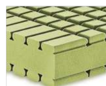
H1 - Accogliente