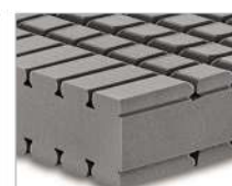
H3 - Sostenuto