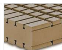
H2 - Equilibrato